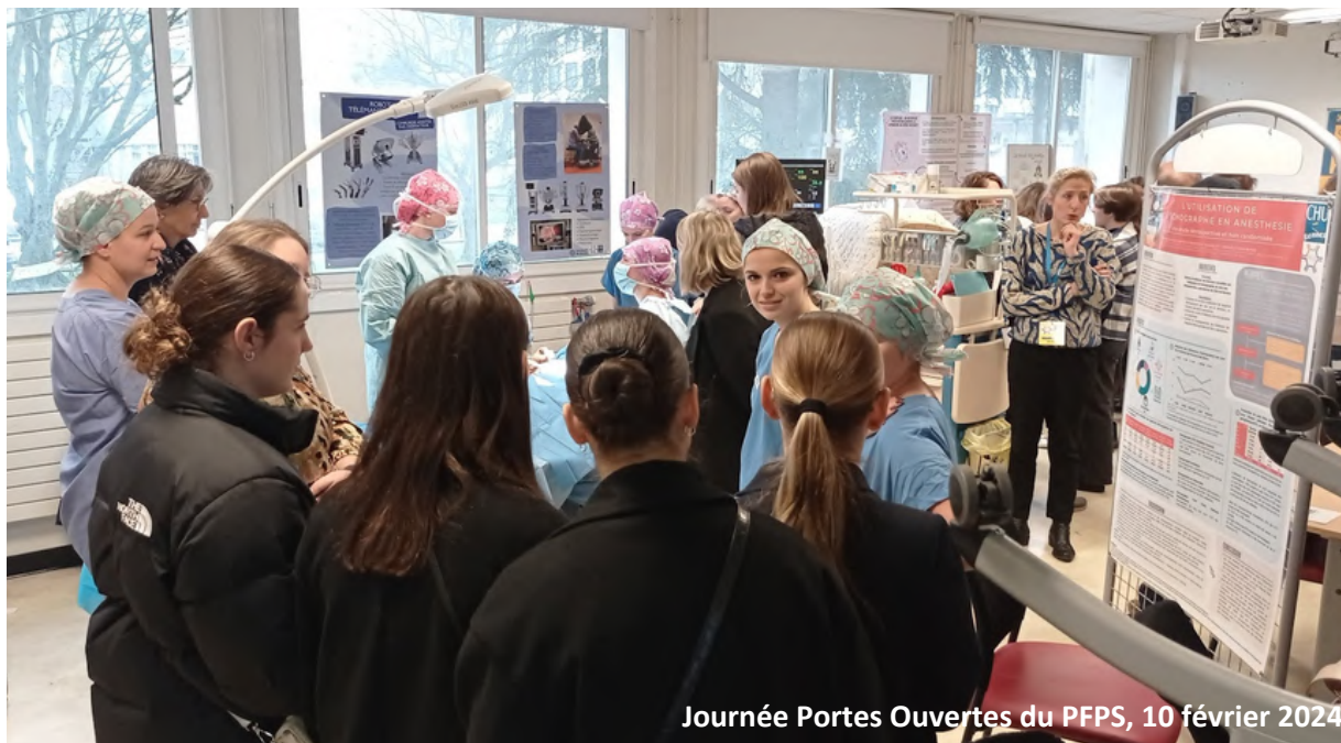
Journée Portes Ouvertes du PFPS, 10 février 2024