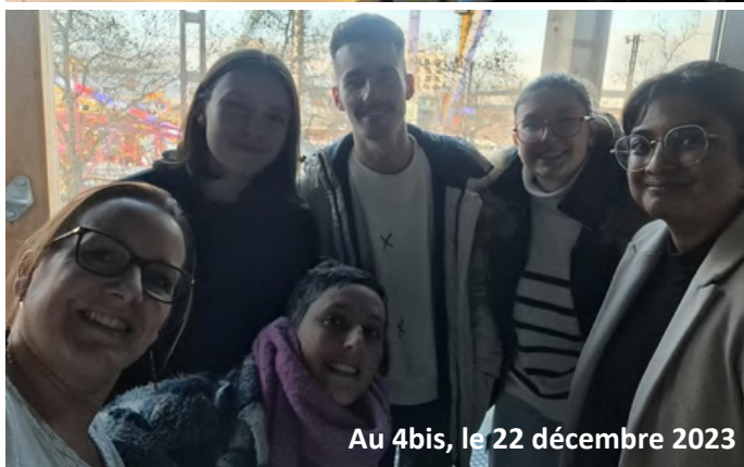
Au 4bis, le 22 décembre 2023

Notre collectif est ouvert : tu peux nous rejoindre sur le projet de ton choix ! Saches que tu t'investiras quand et comme tu en auras envie : à ton rythme !