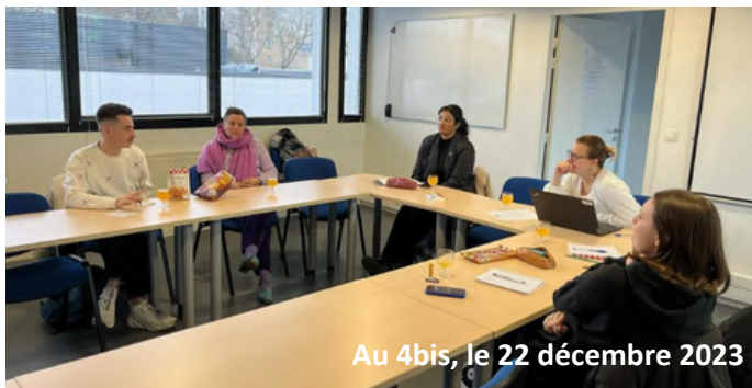
Au 4bis, le 22 décembre 2023

-Notre présence aux journées portes ouvertes ! Pour la première fois, la CVEE s'est présentée aux futurs élèves et étudiant.es du PFPS. Certains d'entre eux nous ont témoigné une grande attention ; ils envisagent même de nous rejoindre l'année prochaine. Une excellente nouvelle pour l'avancée des projets qui deviennent de plus en plus concrets.